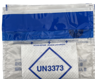
BIOHAZARD BAG GRANDE