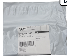
BUSTA DI SPEDIZIONE